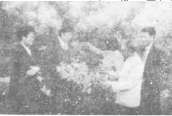
6月中旬以来，林果发生多种病虫害，河口区新户乡党委、政府领导带领科技人员深入果园，帮助果农治虫防病，深受群众欢迎。

芦笋生产使坡韩人摆脱了农业生产的徘徊局面，“三高”农业为坡韩人铺就了一条“小康之路”。（郭忠瑞）